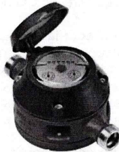
Imagen del medidor actual

Marca: AMCO HONEYWELL A20 3/4" Modelo: AMCO 20 con conexión de salida y entrada en 3/4" Certificados de: verificación o calibración.