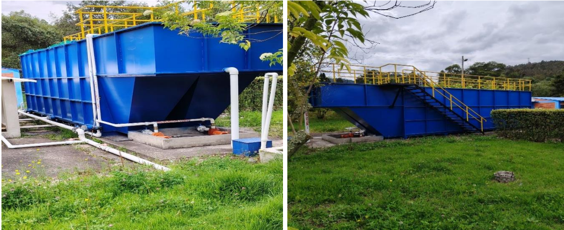
Planta de tratamiento agua domestica