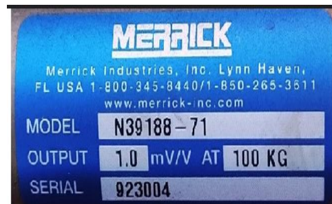
Fig. 4. Báscula Merrick características