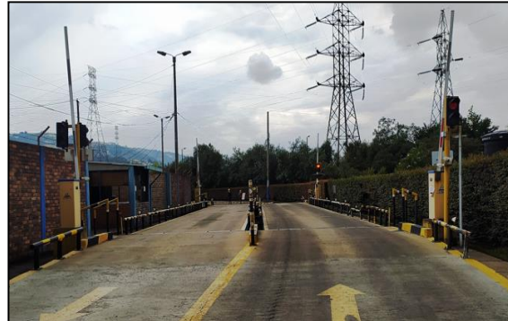
Fig. 5 monitor bascula camionera Rice Lake y plataforma