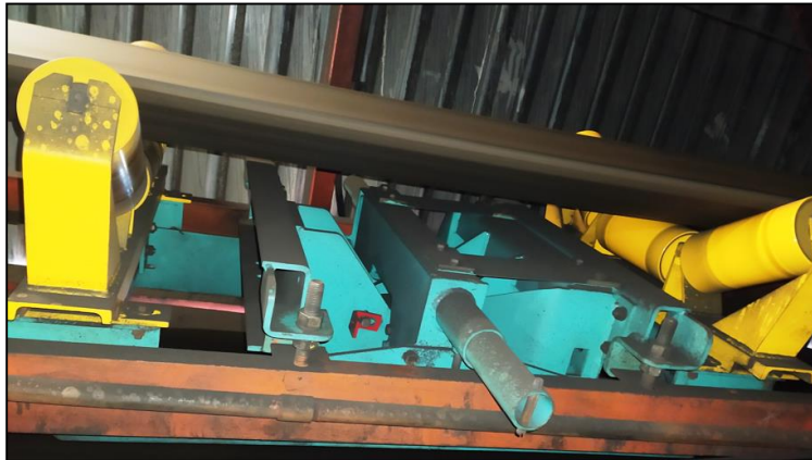
Fig. 1 Báscula Schenck