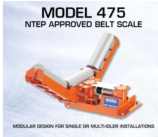
Fig. 3. Báscula MERRICK