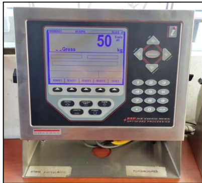
Fig. 4 características básculas camioneras Rice Lake de entrada y salida